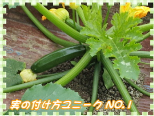
実の付け方ユニークNO.1