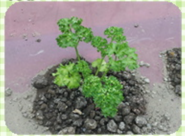
これは、パセリです。 お弁当などのアクセントの必需品!