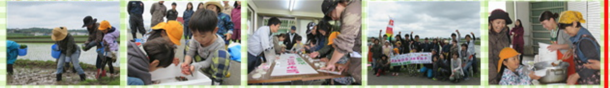
泥こ足を取られて悪戦苦闘! とじょうに興味津々の様子 参加者みんなで共同作業中 みんな一緒にガッツポーズ みんなでお昼はカレーライス!

5月28日(日)、コープさっぽろ活動部主催の田植え体験が行われ、当部会からは昼登準備のお手伝いに参加しました。当日は田植えの他に、お米から出来た糶を使用して作った横断幕と一緒に記念撮影をしたり、「JAみねのふで販売している「土生米」の生産圃場に放たれている「とじょう」がお目見えし、子供達の目を楽しませていました。秋には「稲刈り体験」が行われる予定です。