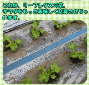
これは、リーフレタスの苗。 サラダをもっと美味しく変身させちゃ います。