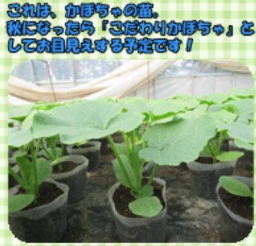
これは、かぼちゃの苗。 秋になったら「さだわりかぼちゃ」と してお目見えする予定です!