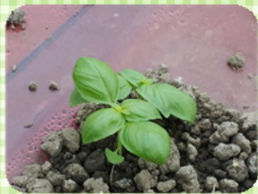
これは、バジルの苗です。 イタリアン料理には欠かせない食材です よね!