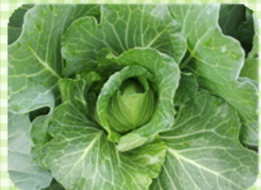
これは、キャベツ。 真ん中が丸くなって来ていて、どんど ん大きくなっていきます。