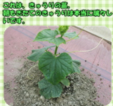
これは、きゅうりの苗。 胡もぎたてのきゅうりは本当に美味しいです。

きゅうりのような この野菜の正体は・・・ 「ズッキーニ」です! 実の付け方が何とも珍しい野菜 です。きゅうりのように見ま あが、なんと「かぼちゃ」の仲 間なんです! 当部会でも生産 者が順次出荷 しております!