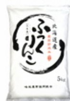
トドック仕様 香りの畦みちハーブ米 米ななつぼし 5kg