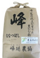
「峰」香りの畦みちハーブ 米ななつぼし 5kg