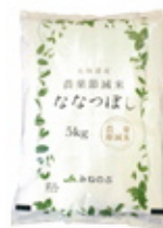
トドック仕様 土生米(どじょうまい) ふっくりんこ 5kg