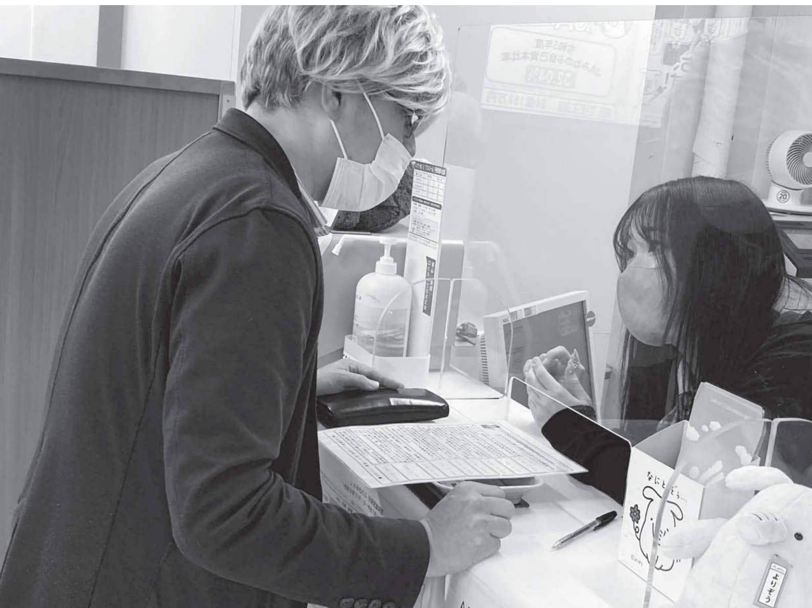
防犯訓練 (R7.1.22 峰延農協金融店舗)