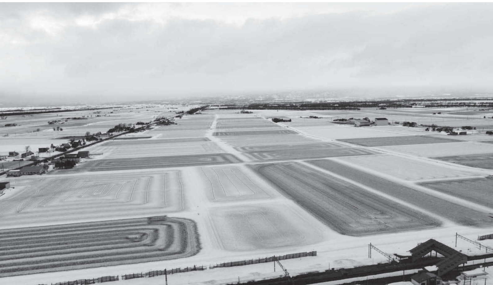
融雪剤散布風景 峰樺地区